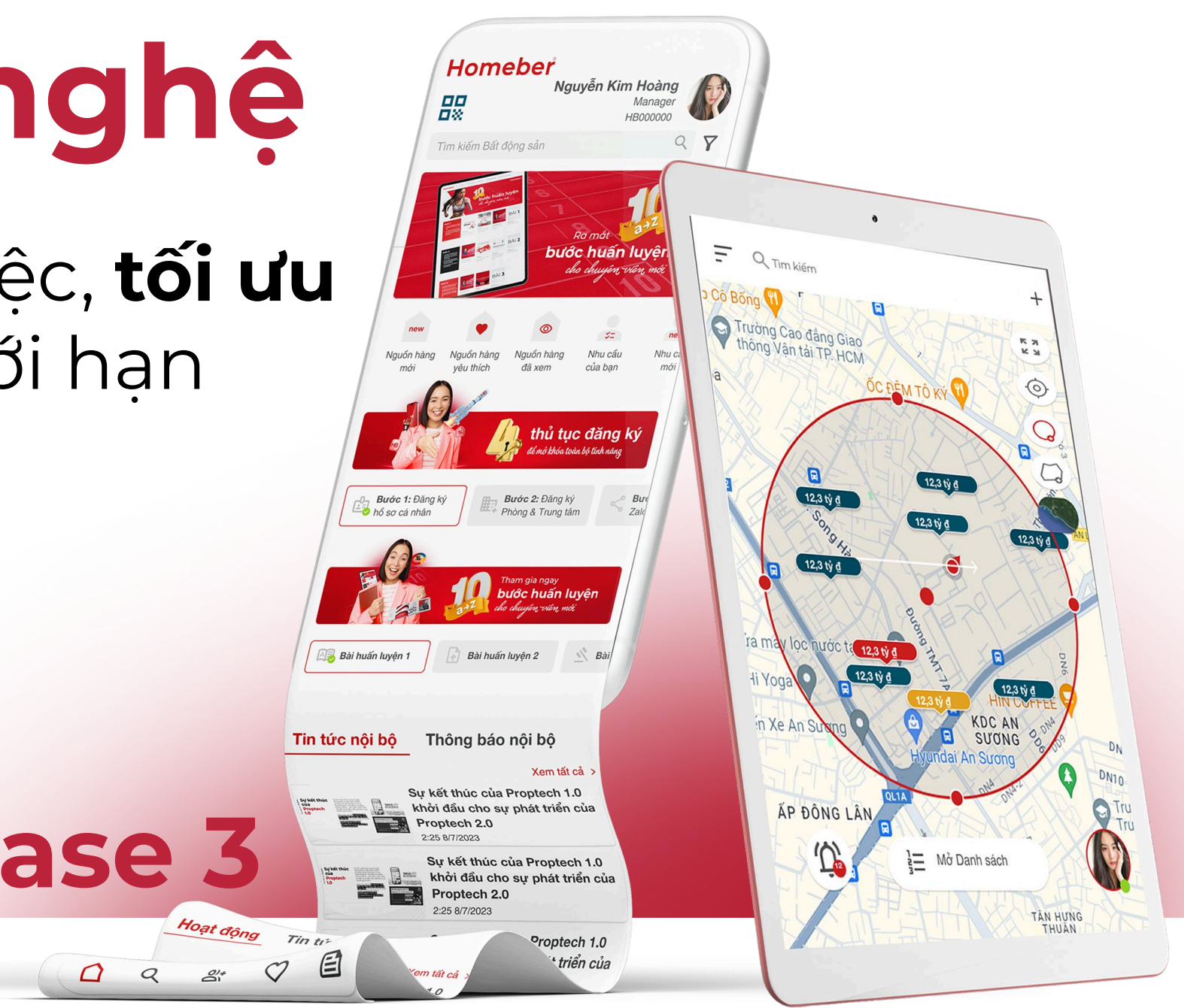
Ứng dụng kho hàng Homeber